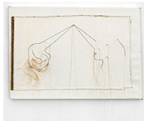
Trasslig soffa och dam med märken , 2019, 40 x 58 cm © Marie-Louise Ekman

Trådteckningarna hämtar nerver från insamlade nystan sparade i den inre bildbanken; rummen och interiörerna är bekanta. Man lockas tro att händelserna är kända sedan tidigare, när spänningen upprepas som vaga efterskalv mellan människor och tingen sig emellan. Dramerna utspelas som långväga och dröjande ekon, som en utdragen ton. Köttet omsluter sitt levda liv och förvarar de bräckliga minnena likt ärrade vägar för tanken att följa. De återskapas till priset av att de förvanskas. Nyfikna fåtöljer, spetsiga näsor och näsvist ritande hus spårar som pickup:en över livets envist snurrande skivtallrik. I vinylvärlden spelas de allt gråare ju mer innehållet älskas. Det är grymt och förlåtande på en och samma gång.