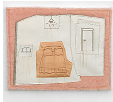
Köttisäng i rum , 2019, 42.5 x 62.5 cm © Marie-Louise Ekman