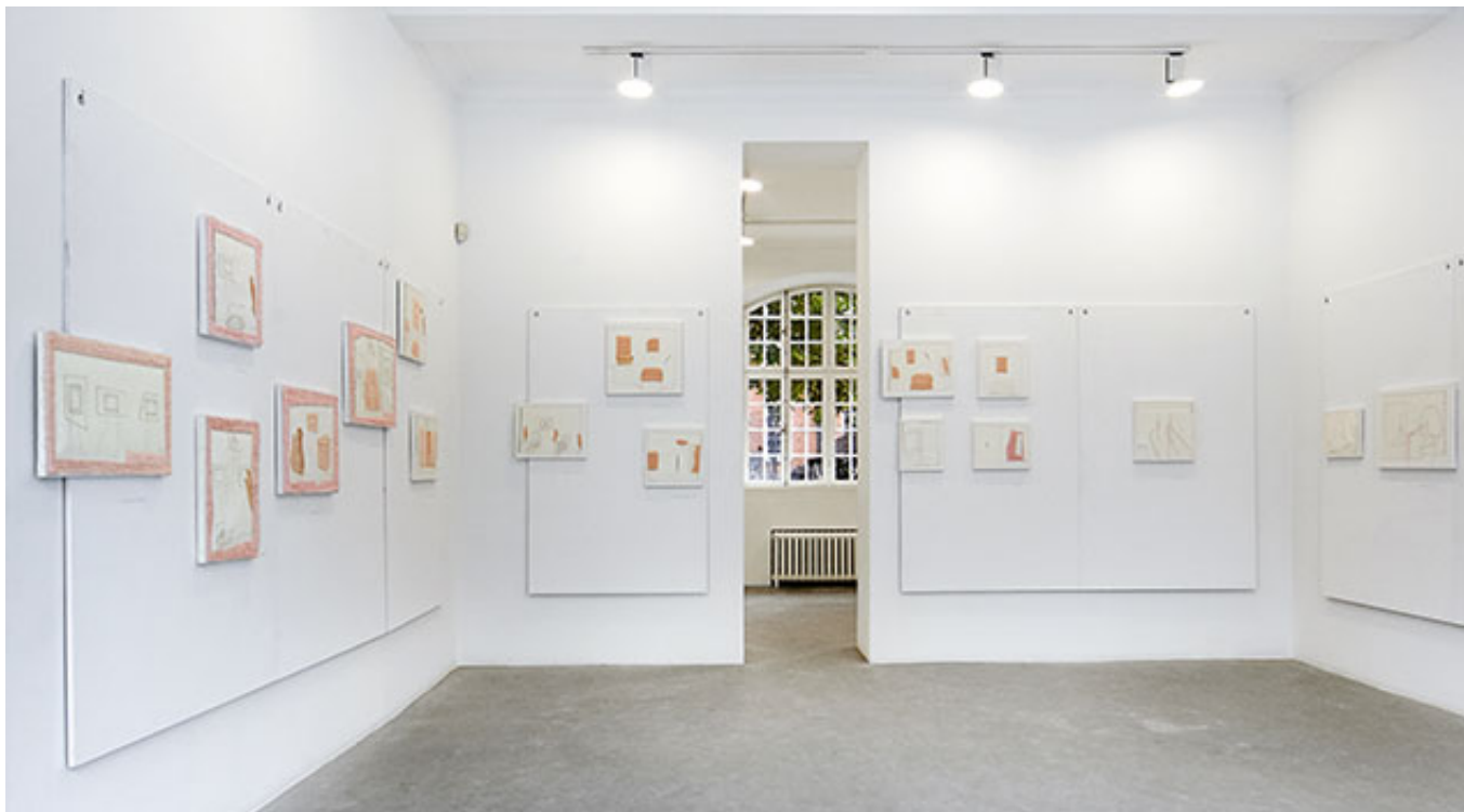
Installationavy (Klicka på bilden för hög upplösning).