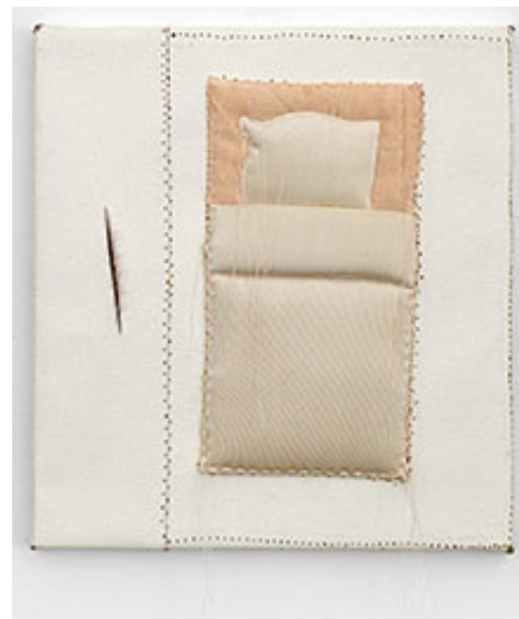
Säng med trådar , 2019, 33 x 30 cm © Marie-Louise Ekman

Ackordet är lågmält, den grängade dukens vita grund präglas av rosa stygn. De fäster även Marie-Louise Ekmans rekvisita av köttrosa, sidenblanka och lurvmjuka applikationer. Kött i rum leder vidare, till Köttmöbler i rum och fortsätter till köttssängen med sin lysande lampa över sig. Ett livs inpräglade mönster och vanor skärskådas i skär blyxtbelysning.