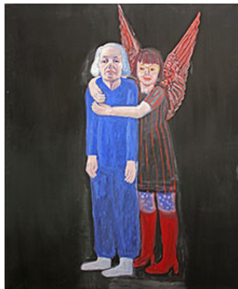
Ängeln , 2010 © Lena Cronqvist