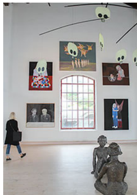
Installationsvy (Klicka på bilden för hög upplösning)

Två närmast ikoniska konstnärer har sammanförts i sommarens utställning på Lokstallet i Strömstad – Lena Cronqvist och Jan Håfström. Båda har befunnit sig i den svenska konstens spjutspets i över 50 år. Att sätta samman två konstnärer med en så utpräglad egenart som Lena Cronqvist och Jan Håfström är ett vågspel. Men Lena Cronqvists knivbeväpnade flickor och änglar möter Jan Håfströms döskallar och svarta korpar och ett samtal börjar dem emellan, någon form av samförstånd uppstår. De existentiella frågorna står i centrum och de har båda sin utgångspunkt i upplevelser i barndomen.