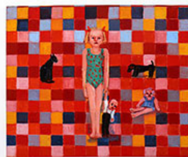
Den namnlöse , 2009 © Jan Håfström Flicka, dockor, katt och hund , 1994 © Len Cronqvist