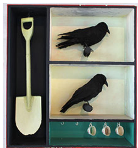
Den sista måltiden , 2005 © Jan Håfström