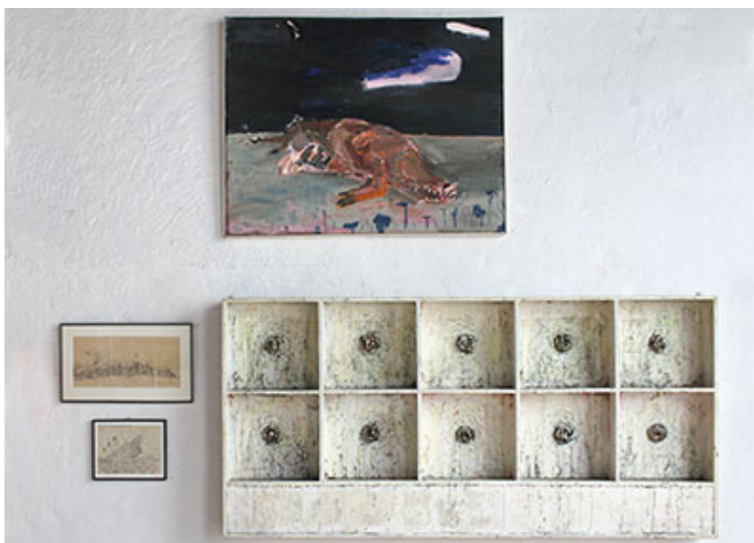
Flykten till södern , 1964 © Lena Cronqvist Barnteckningar 1940-tal, Planetarium 1990. © Jan Håfström

En rundvandring i utställningen präglas för min del av återseendets glädje, men också av upptäckten av nya infallsvinklar och betydelser. Båda har sin egen ikonografi, som gör det enkelt att urskilja vem står bakom varje verk. Ingen förväxling riskeras. Där Cronqvist fokuserar på familjen och mänskliga relationer blickar Håfström ut över landskapen och skildrar de fysiska förutsättningarna för mänskligt liv. De perspektiven, långt bort och nära, kompletterar varandra.