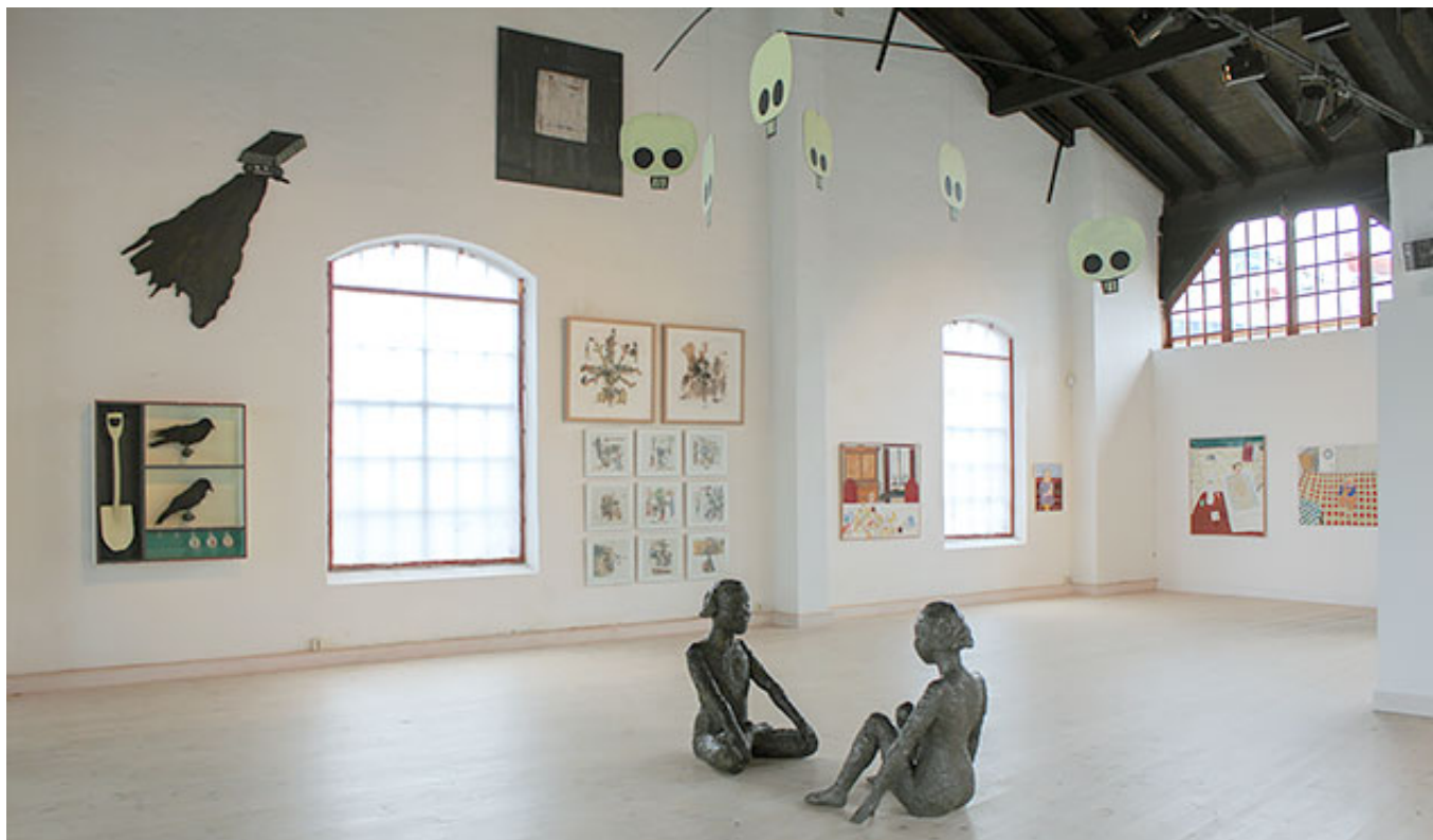
Installationsvy (Klicka på bilden för hög upplösning)

Två närmast ikoniska konstnärer har sammanförts i sommarens utställning på Lokstallet i Strömstad – Lena Cronqvist och Jan Håfström. Båda har befunnit sig i den svenska konstens spjutspets i över 50 år. Att sätta samman två konstnärer med en så utpräglad egenart som Lena Cronqvist och Jan Håfström är ett vågspel. Men Lena Cronqvists knivbeväpnade flickor och änglar möter Jan Håfströms döskallar och svarta korpar och ett samtal börjar dem emellan, någon form av samförstånd uppstår. De existentiella frågorna står i centrum och de har båda sin utgångspunkt i upplevelser i barndomen.