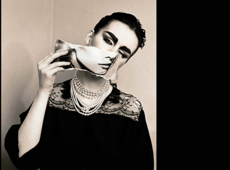
Sylvass feminism i kollageform