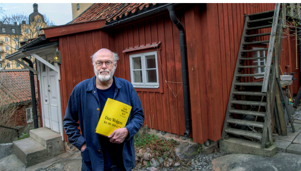
Vilket hallå det blev i konstvärlden